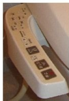
温水洗浄便座 完備