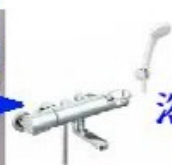
浴室 流し台 水栓交換