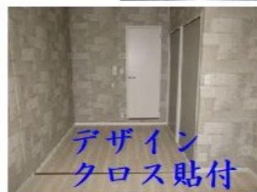
デザイン クロス貼付