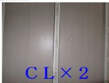
CL x 2